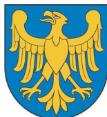
Marszałek Województwa Śląskiego