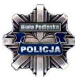
Komenda KWP Policji Katowice