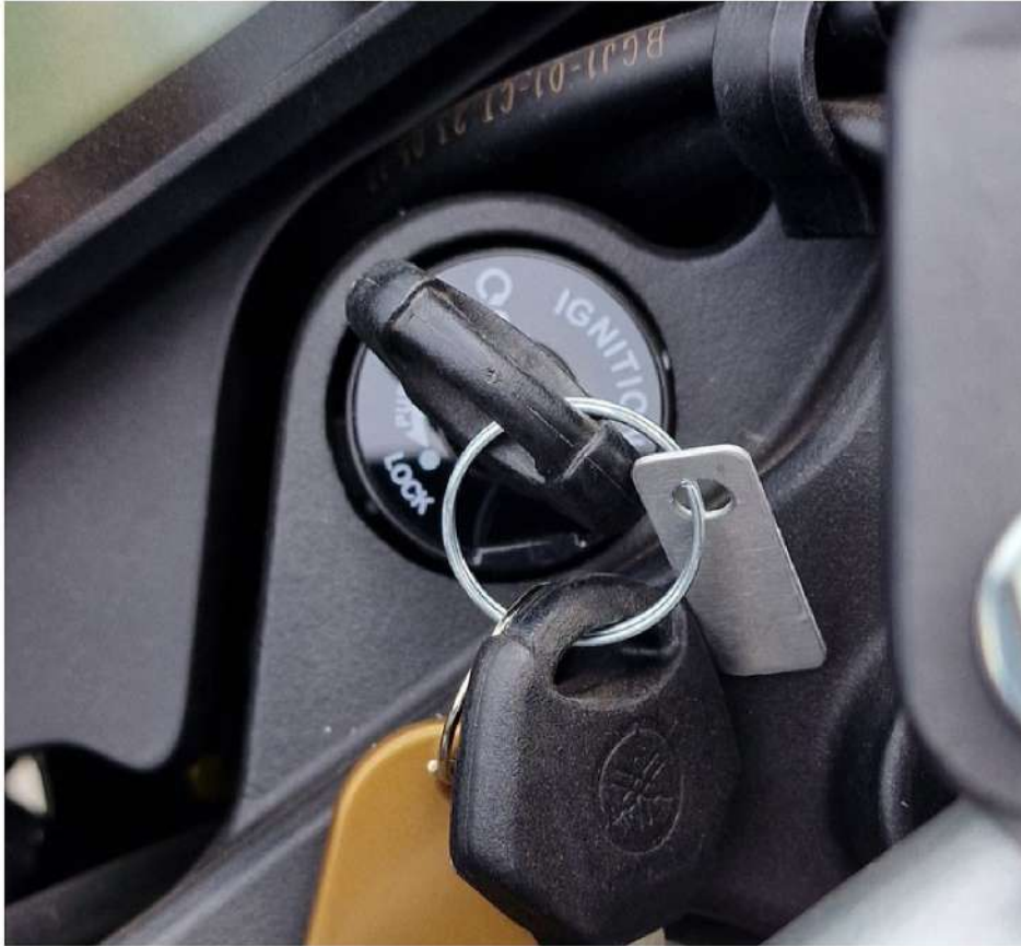
KLUCZYK W POZYCJI "ZAPŁON"